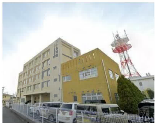
医療法人小島慈恵会小島病院まで662m