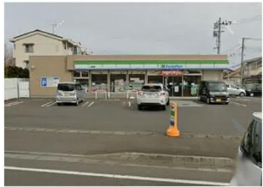
ファミリーマート岩沼桑原店まで365m