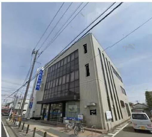
七十七銀行岩沼支店まで482m